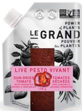
LIVE TOMATO PESTO VIVANT

A pesto with a spicy fiesta of flavours!